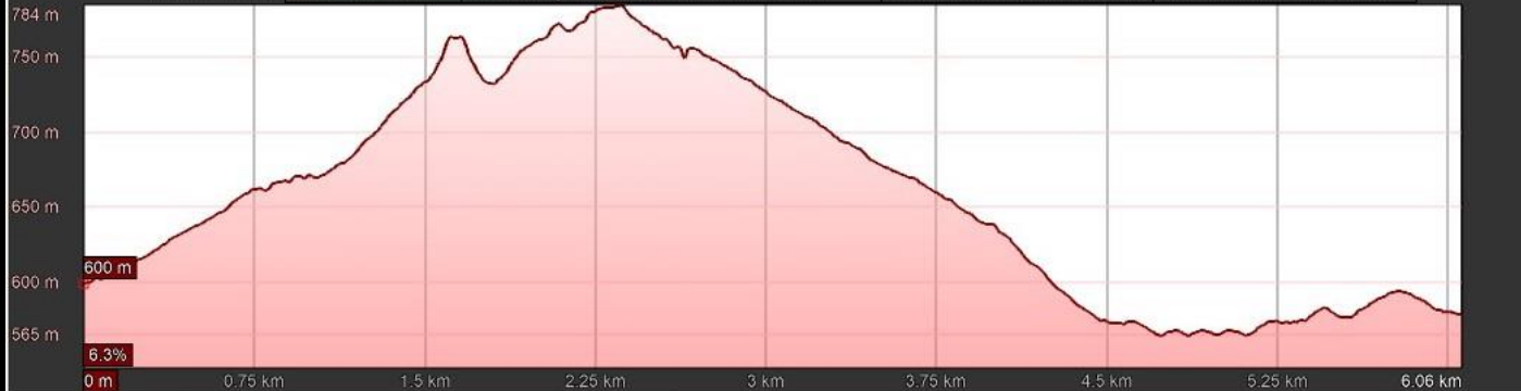
Gráfico: min., media, máx. Elevación: 565, 661, 784 m Total de intervalo: Distancia: 6.06 km Incremento/pérdida de elevación: 295 m. -314 m Pendiente máxima: 41.0%. -39.8% Pendiente media: 9.6%. -9.2%